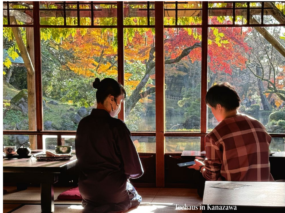
Teehaus in Kanazawa

Nach einem Transitstopp von zwei Stunden, während dem Sie etwas essen oder sich frisch machen und die Beine vertreten können, geht es weiter mit