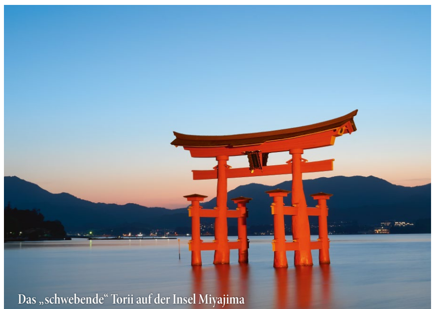
Das „schwebende“ Torii auf der Insel Miyajima

Wir senden zunächst unsere Koffer weiter nach Takayama. Mit dem Zug geht es mit kleinem Gepäck nach Kanazawa, einer Großstadt am Meer. Die Stadt ist unter anderem für ihren Samurai-District bekannt. Nach dem Mittagessen besuchen