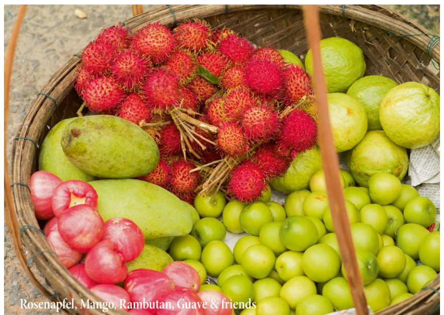
Rosenapfel, Mango, Rambutan, Guave & friends