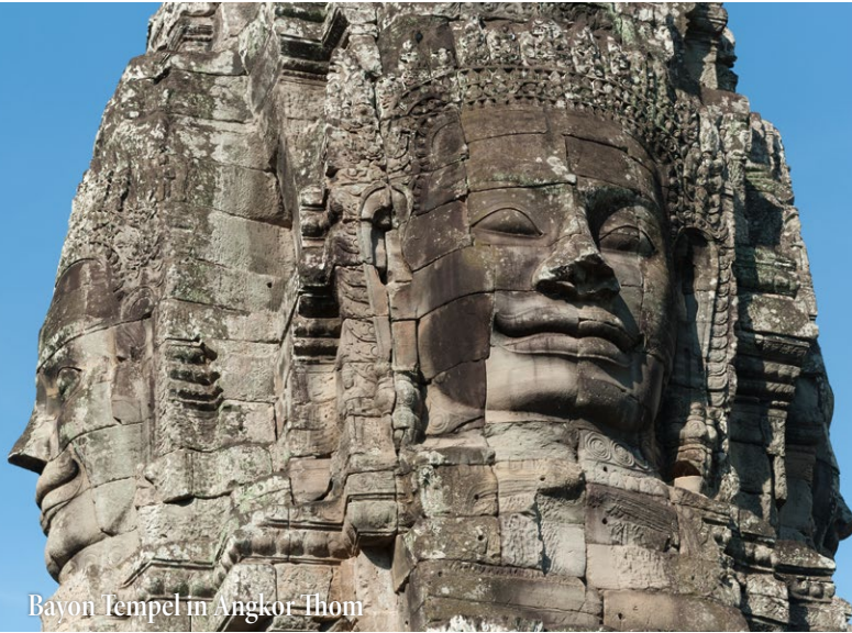
Bayon Tempel in Angkor Thom