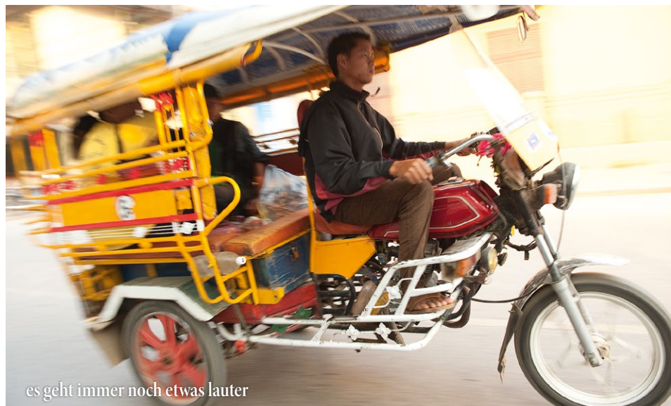
es geht immer noch etwas lauter

Sie reisen selbst aus Europa nach Luang Prabang an. Da bei unseren Indochina- und Thailandprogrammen meist mehrere Gäste Badeverlängerungen an die Reise anschließen, bieten wir dieses Programm