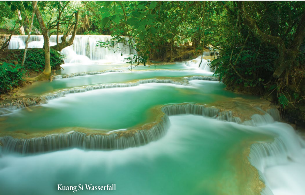
Kuang Si Wasserfall