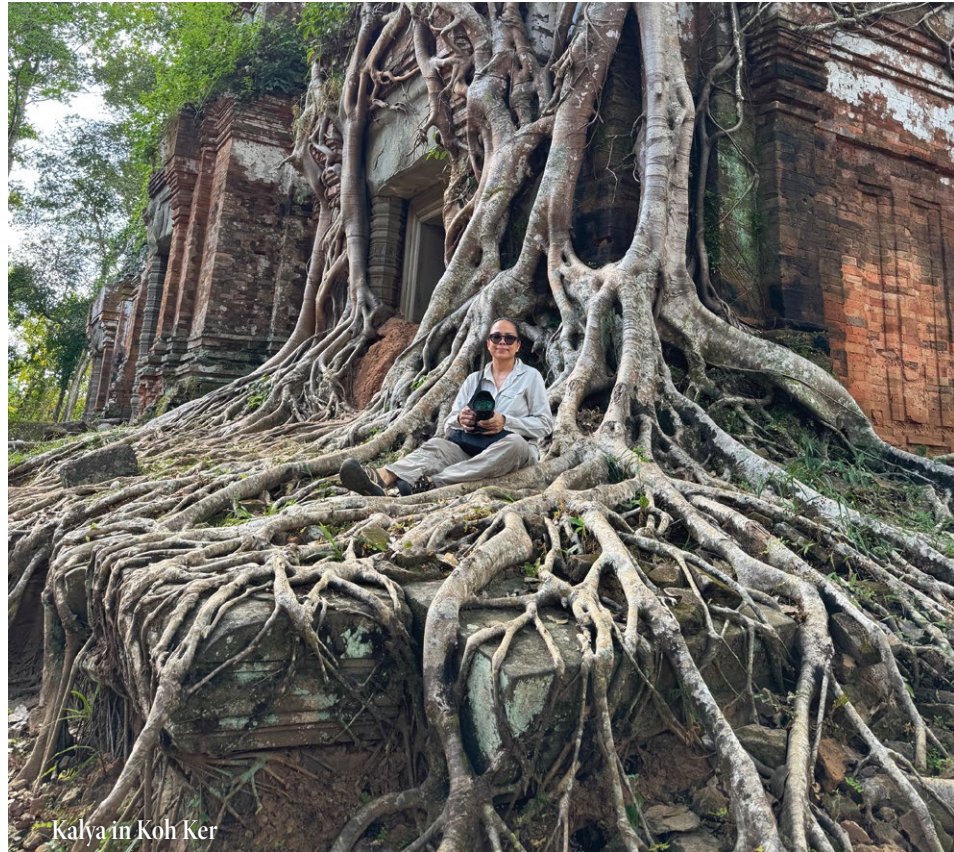
Kalya in Koh Ker

Ganz im Süden von Laos tauchen wir in eine Flusslandschaft ein – in das Gebiet der Si Phan Don, auch bekannt als die Region der 4.000 Inseln. Hier erreicht der Mekong seine größte Breite. Über Jahrtausende hat der Fluss eine einzigartige Landschaft geformt, in der zahllose Inseln, Sandbänke und Wasserarme entstehen. Die Lphi-Wasserfälle zählen zu den spektakulärsten Stromschnellen des Mekong und bildeten einst ein natürliches Hindernis für den Handel und die Schifffahrt. Nächtigung in Si Phan Don. 1 N