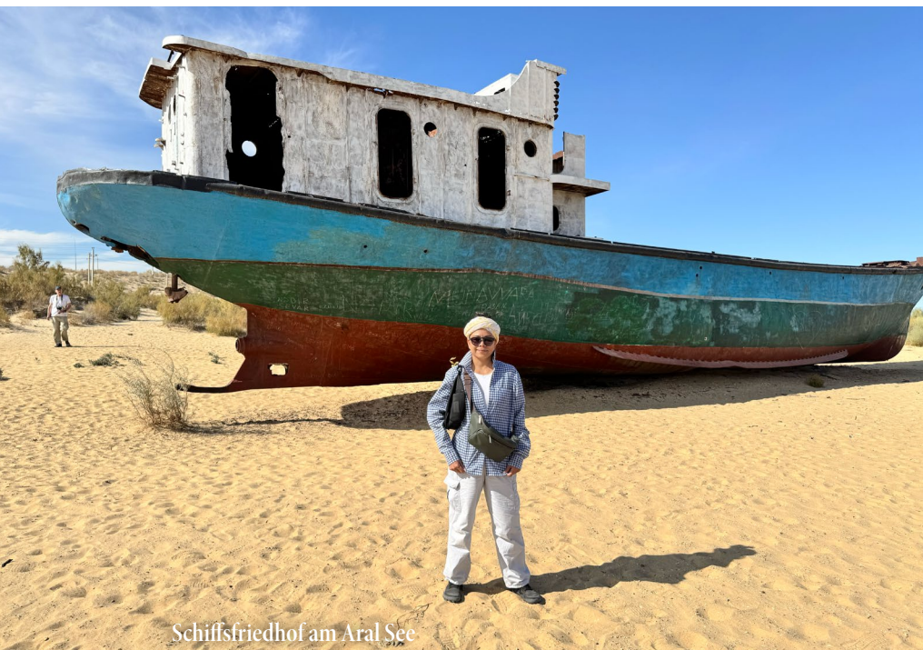
Schiffsfriedhof am Aral See