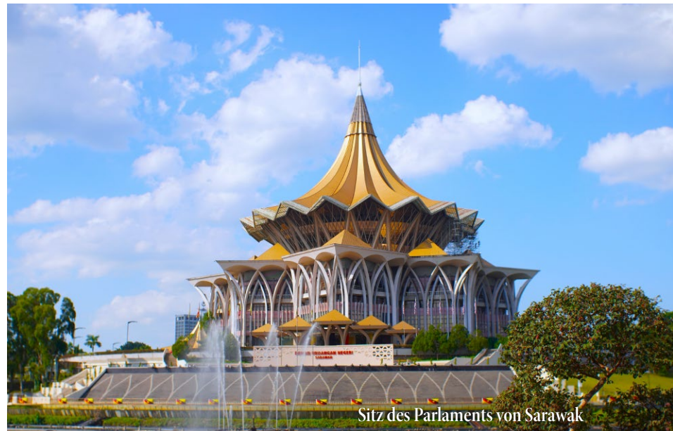
Sitz des Parlaments von Sarawak

Vormittags besuchen wir das berühmte Sepilok Orang-Utan Rehabilitation Centre, wo verwaiste und konfiszierte Orang-Utans wieder in die Wildnis zurückgeführt werden. Bei der Fütterung um 10 Uhr beobachten wir die Tiere an den Futterstationen im Regenwald. Anschließend geht es zum benachbarten Bornean Sun Bear Conservation Centre, wo über 30 Malaienbären in Schutz und Auswilderung leben. Mittags Fahrt nach Sukau am Kinabatangan-Fluss. Nach dem Mittagessen und Einchecken in der Lodge unternehmen wir eine Bootsfahrt flussaufwärts auf dem Menanggul, einem Seitenarm des Kinabatangan, auf der Suche nach Nasenaffen, Vögeln und anderer Tierwelt. Nächtigung in der Lodge, 2 N