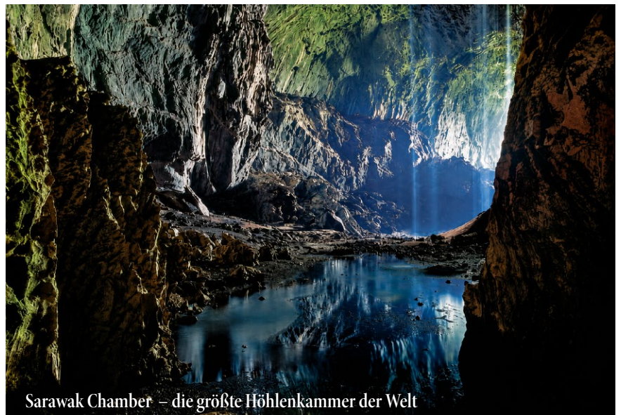
Sarawak Chamber – die größte Höhlenkammer der Welt

Di, 06. April: Mulu – Clearwater & Wind Cave (F/M/A) Mit dem Langboot fahren wir flussaufwärts zur Wind Cave mit ihrer eindrucksvollen „King's Chamber“. Ein kurzer Bohlenweg, an der Kalksteinklippe entlang, führt weiter zur Clearwater Höhle – eine der längsten Höhlen Südostasiens. Picknick-Mittagessen, Bademöglichkeit in einem türkisfarbenen Naturbecken unter Regenwald-Riesen.