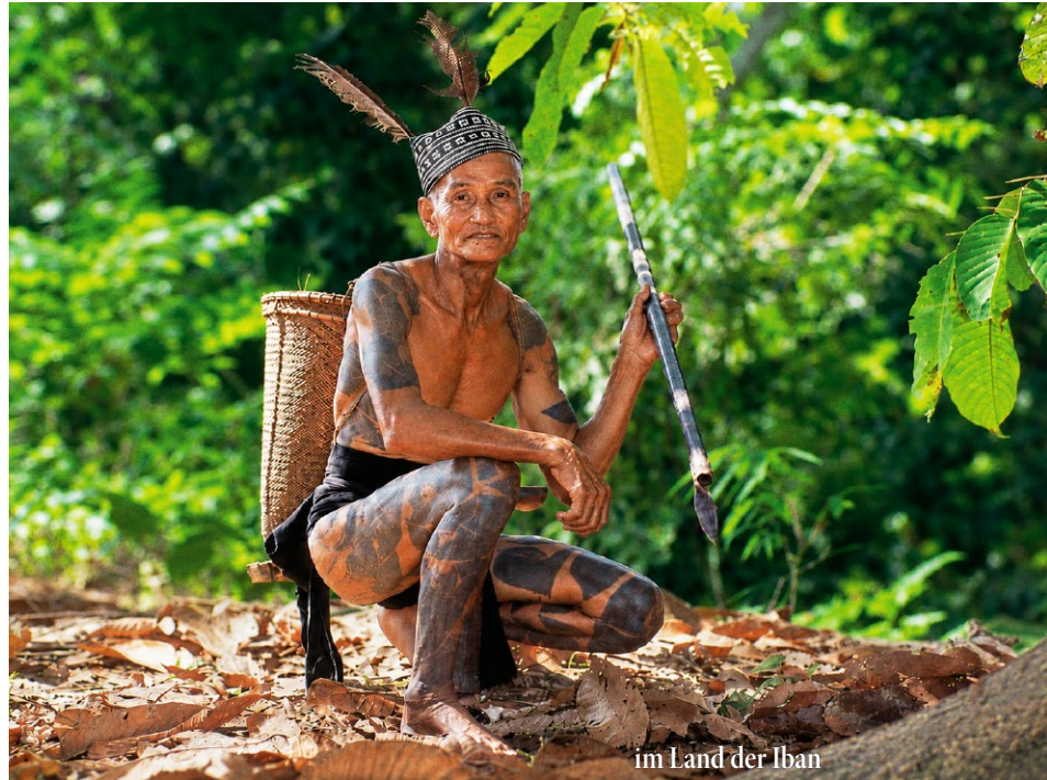
im Land der Iban

Wir reisen gemeinsam mit Turkish von Wien über Istanbul Richtung Singapur an. Der Abflug in Wien ist mit Turkish TK 1884 um 10.50 Uhr geplant. Die Landung in Istanbul erfolgt ca. um 14.10 Uhr. Nach einem Transitstopp von nicht ganz 3 Stunden geht es weiter mit TK 208, geplant um 17.00 nach Singapur, wo wir geplant um 08.45 Uhr am nächsten Tag landen werden.