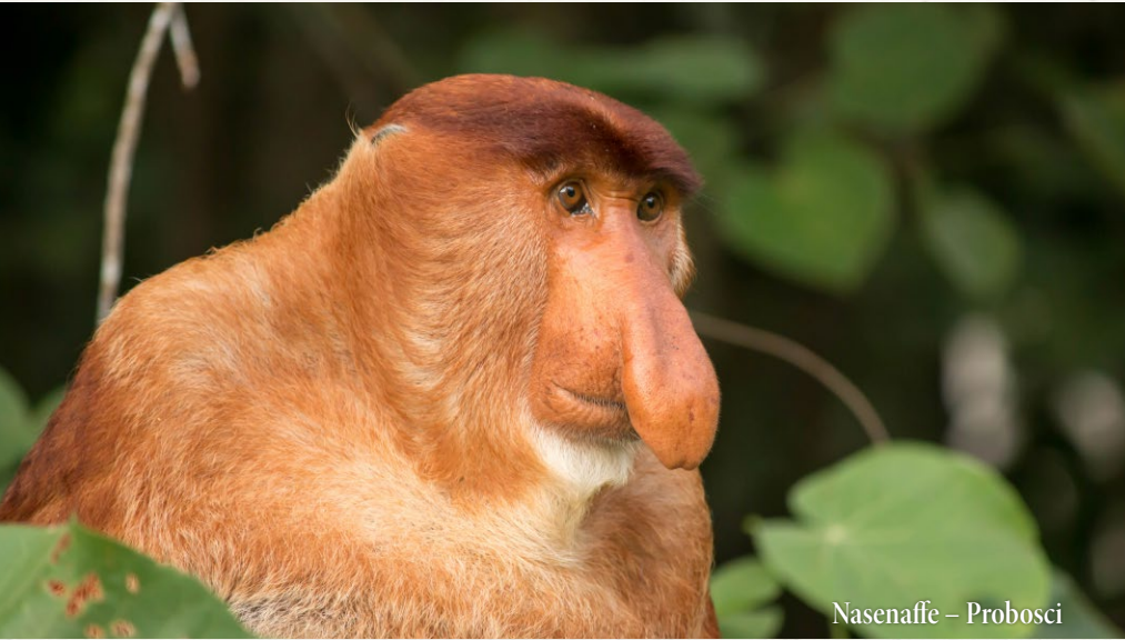
Nasenaaffe – Probosci