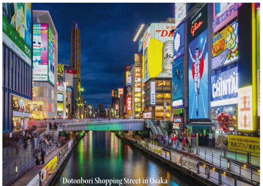
Dotonbori Shopping Street in Osaka

Nach dem Mittagessen besuchen wir den historischen Stadtteil Sanmachi Suji. Während der Edo-Zeit (1603 – 1868, Herrschaftszeit der Tokugawa-Shogune) war Takayama ein pulsierender Drehpunkt für Kunsthandwerker, Landwirte und Kaufleute aus der ganzen Umgebung. Anschließend fahren wir nach Hida No Sato, einem einstigen Bergbauerdorf, heute ein Museumsdorf, in dem man das Alltagsleben vergangener Jahrhunderte sehen kann. Rund 30 alte Bauernhäuser veranschaulichen die traditionellen