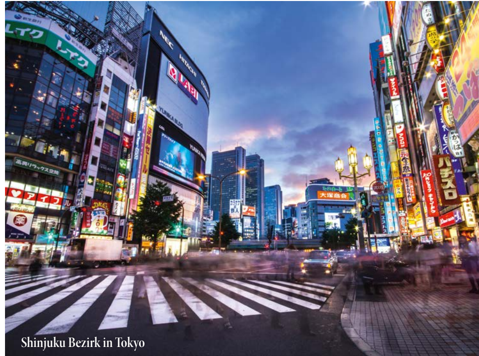
Shinjuku Bezirk in Tokyo

Nach einem Transitstopp von ca. drei Stunden, während dem Sie etwas essen oder sich frisch machen und die