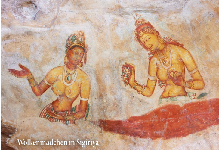
Wolkenmädchen in Sigiriya