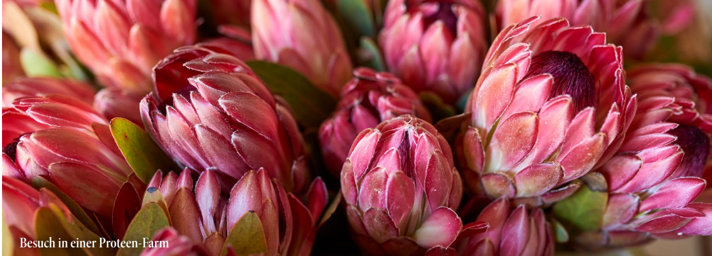
Besuch in einer Proteen-Farm